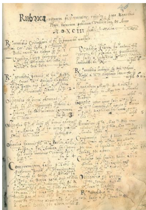
Atti dei notai, n. 1299 (notaio Bernardino Piatti), rubrica

In apertura il registro presenta una rubrica in cui sono riportati i negozi giuridici con il riferimento al numero di pagina corrispondente (indicato con «in folio», «folio»).