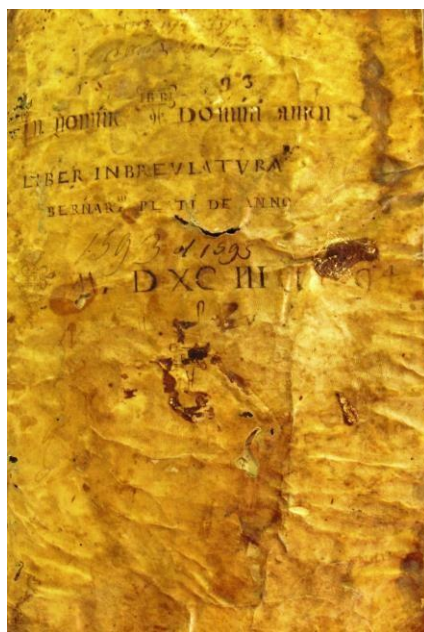
Atti dei notai, n. 1299 (notaio Bernardino Piatti), piatto anteriore

Tra i complessi archivistici conservati presso l'Archivio di Stato di Sondrio sicuramente uno dei importanti è la serie degli Atti dei notai . Tali documenti, versati dall'Archivio Notarile distrettuale, sono rilevanti non solo per la mole di documentazione, pari a 10.802 unità archivistiche definite "buste", ma anche per l'ambito cronologico che coprono, che va dal 1254 al 1898. I materiali notarili sono costituiti prevalentemente da registri di imbreviature, ovvero minute dei negozi giuridici che i notai redigevano prima di predisporre gli originali. Tra le tipologie di documenti si hanno ad esempio vendite, donazioni, testamenti, investiture, ecc. Gli Atti dei notai sono uno dei fondi più consultati dagli utenti dell'Archivio di Stato di Sondrio, perché attraverso lo studio di queste carte è possibile rintracciare testimonianze significative della Valtellina e della Valchiavenna dal XIII al XIX secolo. Molti libri e saggi di storia si basano sulle notizie riportate negli Atti dei notai valtellinesi e valchiavennaschi, utilizzandole come fonti. Oltre ad essere un'imprescindibile miniera per le indagini, i registri notarili possono anche riportare altre tipologie testuali, come i componimenti poetici. È il caso ad esempio del registro contraddistinto dalla segnatura n. 1299.